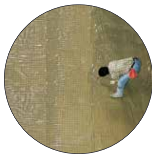
Esempio di posa