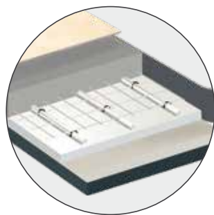
Per pavimenti riscaldati